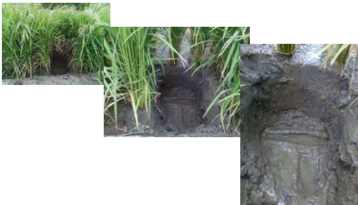
شکل ۲. رطوبت نزدیک به اشباع دایم خاک از کپسول رسی متخلخل مدل GB2 در کرت‌های آزمایشی

متوسط عملکرد دانه در تیمار آبیاری زیرسطحی با کپسول رسی (روش اشباع خاک) در تاریخ کشت اول (خرداد) و دوم (تیر) به ترتیب ۴/۱۲ و ۳/۲۱ تن بر هکتار بود. در حالی که این مقادیر برای تیمار آبیاری غرقابی در تاریخ کشت اول و دوم به ترتیب ۴/۶۳ و ۳/۴۸ تن بر هکتار بود. این نتیجه گواه آن است که عملکرد برنج در