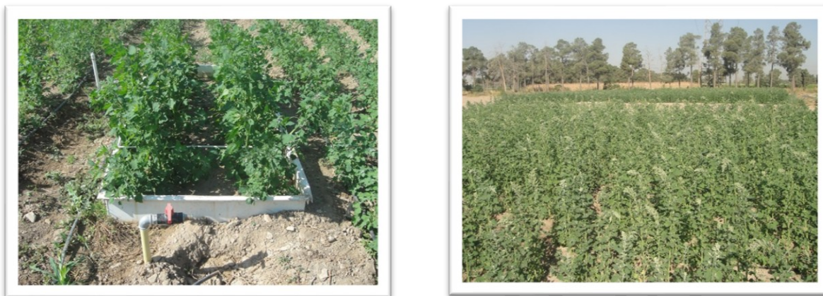
Figure 1. Images of the quinoa experimental farm